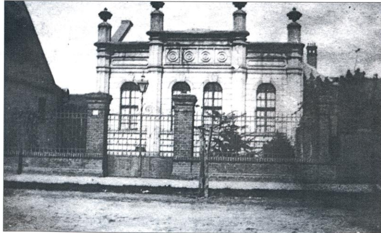
Jevrejska sinagoga u Bekerovoj (Šmitovoj) ulici po izgradnji.

Прва синагога у Белој Цркви изграђена је у тадашњој Јеврејској улици, данашњој улици Саве Мунђана. Била је изграђена од слабог материјала и убрзо је пропала. Другу синагогу белоцрквански Јевреји изградили су 1864. године добровољним прилозима других јеврејских општина.