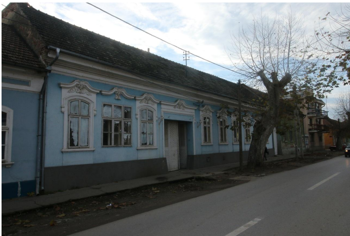
Улица Партизанска -изглед