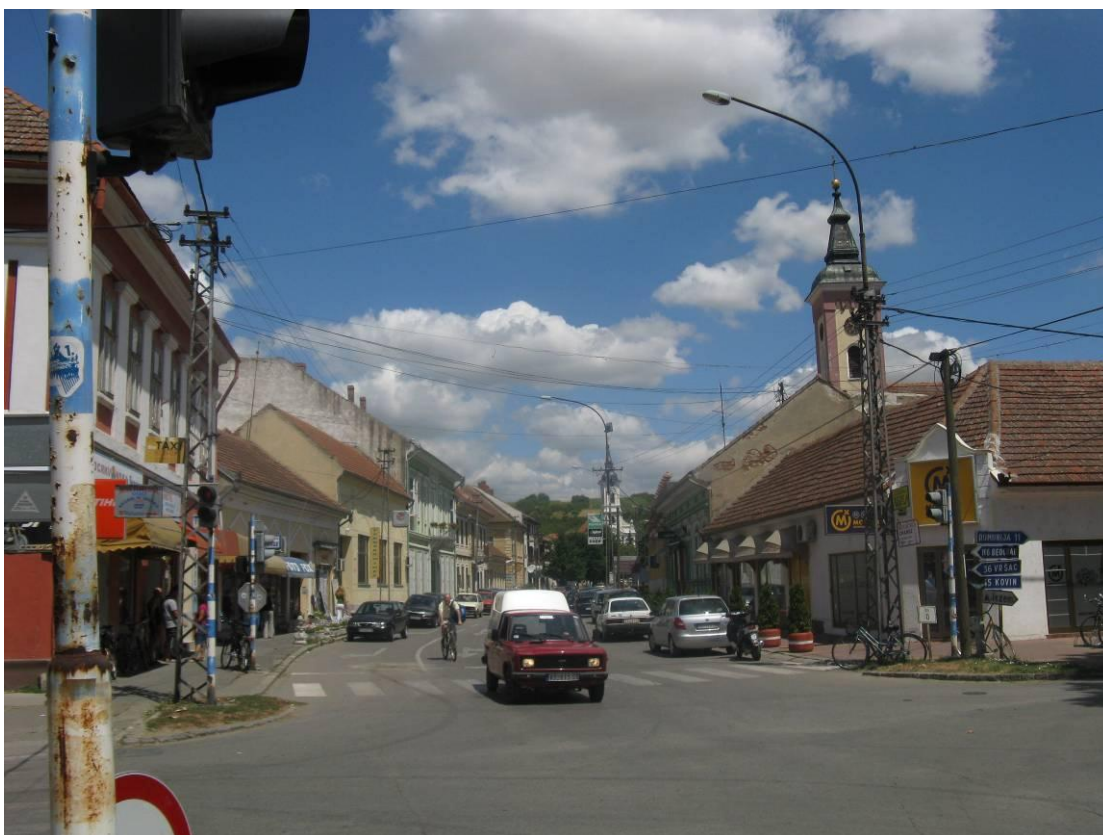
Улица 1. Октобра – изглед