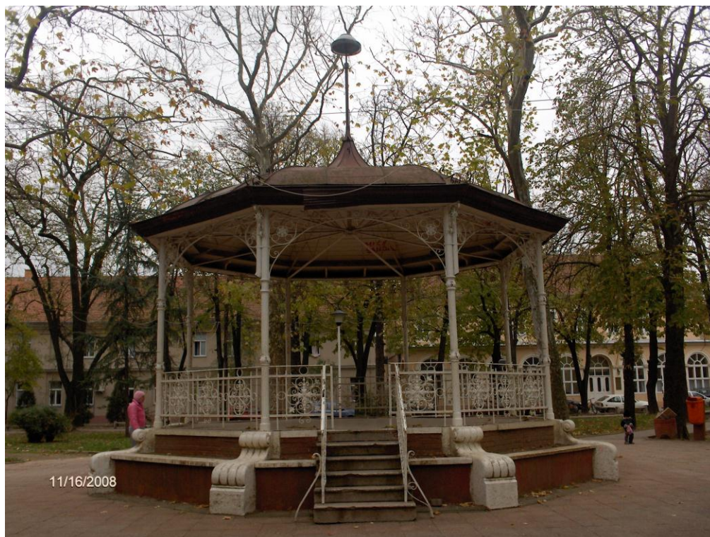
Бели трг - изглед