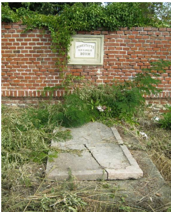
Гробница породице Бем