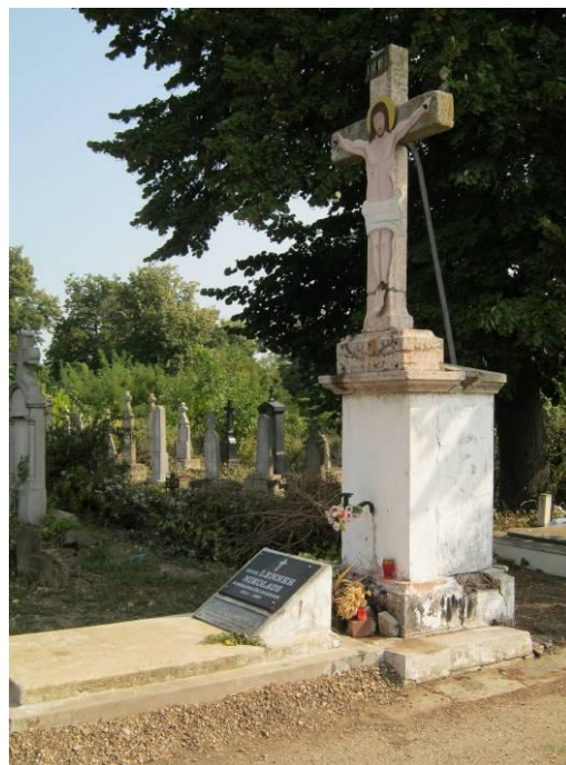
Распеће на главној стази гробља