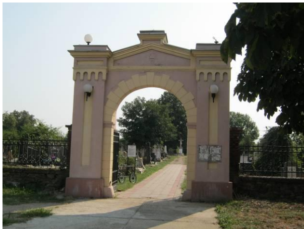
Улазна капија Католичког гробља

Након оснивања Беле Цркве, 1717. године, прво Католичко гробље налазило се од данашње улице Јована Поповића према брегу. Друга локација Католичког гробља била је око Венделин капеле. Одлуком Магистрата из 1825. године Католичко гробље премештено је на данашњу локацију. Уређење гробља трајало је до 1828. године, од када почиње сахрањивање на новој локацији. Одлуком Магистрата из 1840. године на Католичком гробљу сахрањују се Јевреји и протестанти. 1