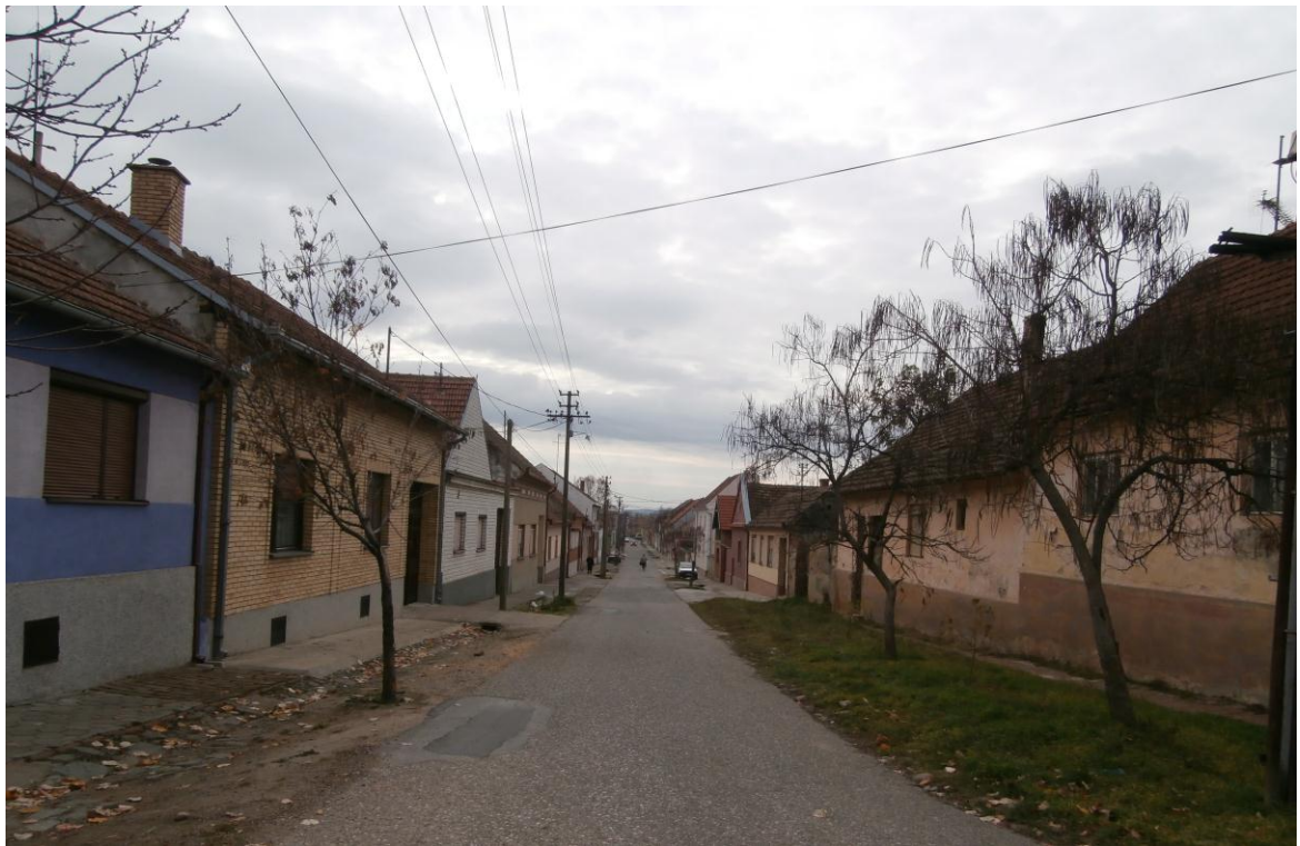
Улица Саве Мунђана - изглед