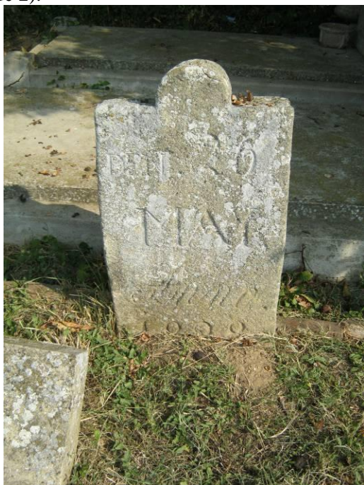
Један од најстаријих пронађених споменика, 1898. г.

Католичко гробље већим делом је запуштено, споменици су оштећени, многи су пали, а пошто нема наследника, не отклањају се оштећења. Капеле су обијене и оскрнављене. Гробље је активно. (режим заштите 2).