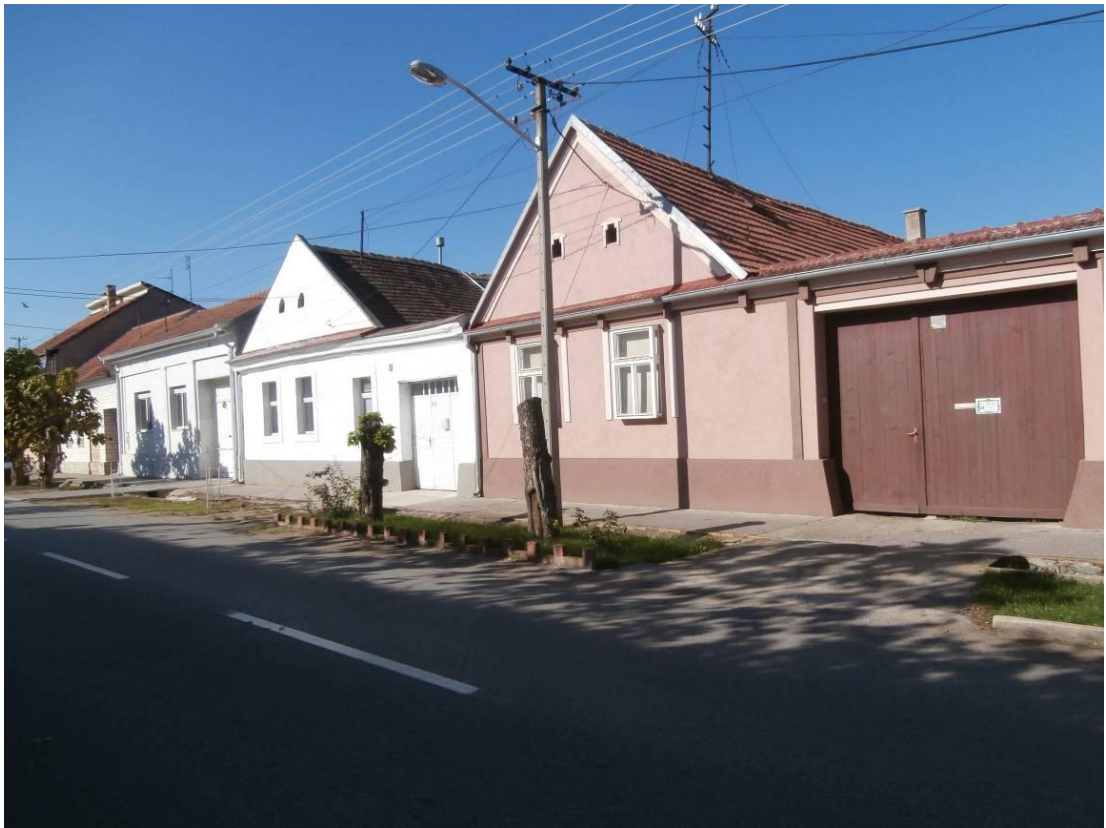
Улица Карађорђева - изглед