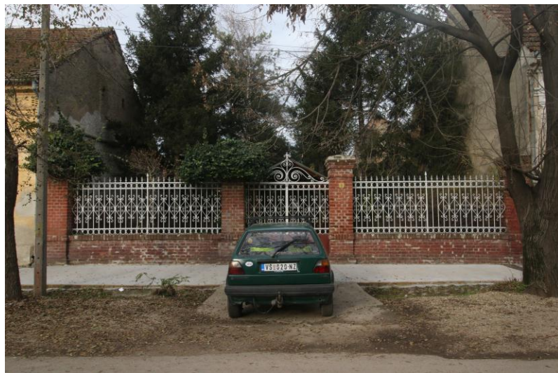
Улазна капија са оградом срушене синагоге

Трећа синагога изграђена је у данашњој улици Дејана Бранкова број 9. Одлуком власти ова синагога срушена је 1949. године. Од синагоге остала је сачувана ограда са капијом и стубовима.