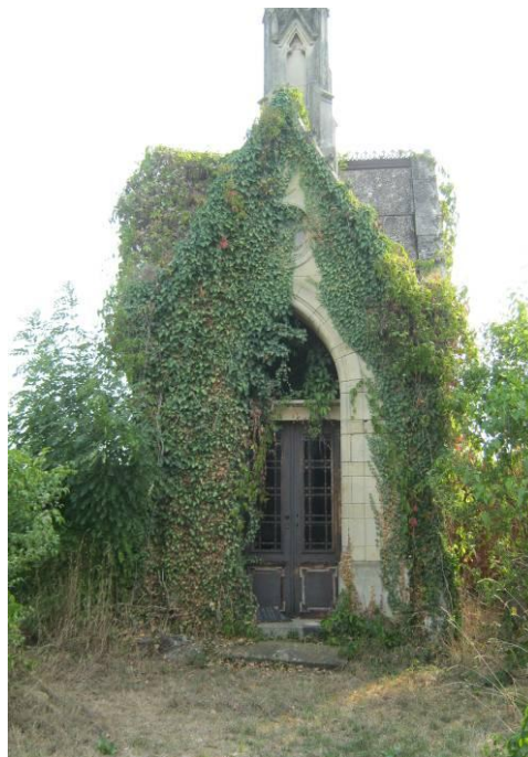
Капела породице Франца Бауера