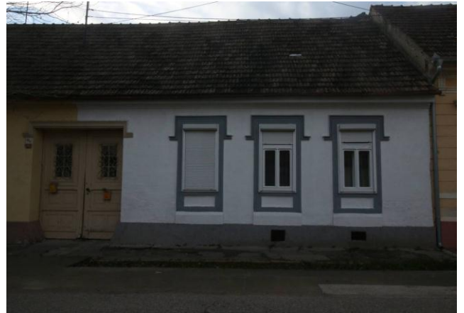
Кућа бр. 46

Угаони објекат, на негулационој линији улица, С. Мунђана и ул. Д. Бранкова. Фасада из улице С. Мунђана, има улазну дрвену дводелну капију, десно од капије су три правоугаона прозора, а са леве стране су четири правоугаона прозора и једна ниша, истих димензија. Сви прозори су уоквирени плитким оквирима. (режим заштите 2).